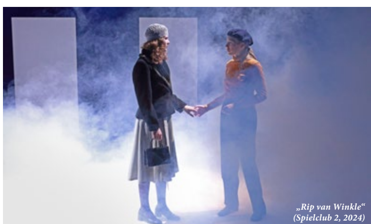
„Rip van Winkle“ (Spielclub 2, 2024)