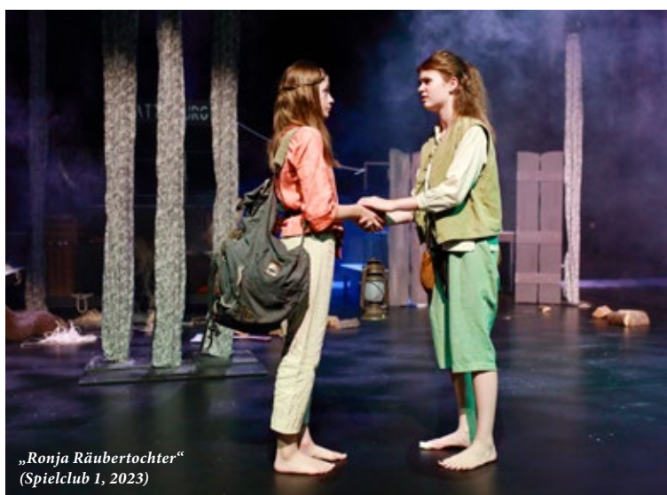
„Ronja Räubertochter“ (Spielclub 1, 2023)

PREMIERE 27. Juni 2025, 18 Uhr | Theatersaal (KUBAA)