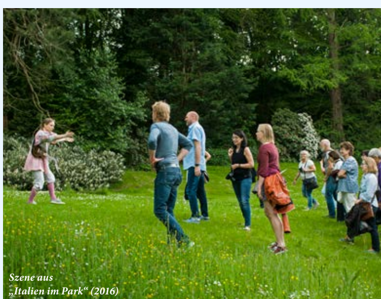
Szene aus „Italien im Park“ (2016)